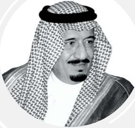
صاحب السمو الملكي الأمير سلمان بن عبد العزيز آل سعود ولي العهد، نائب رئيس مجلس الوزراء، وزير الدفاع