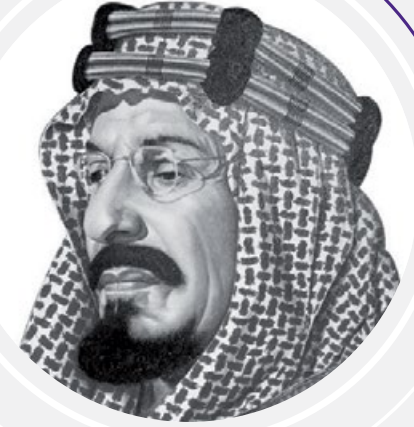
الملك عبدالعزيز بن عبدالرحمن آل سعود (رحمه الله) مؤسس المملكة العربية السعودية