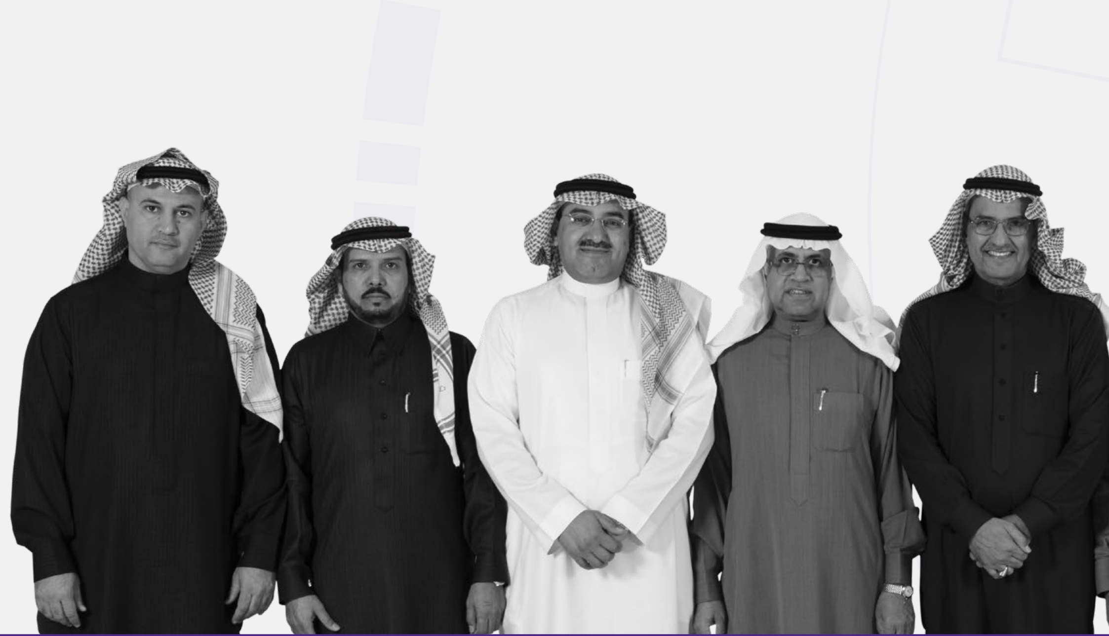
سعادة المهندس محمد بن عمران العمران