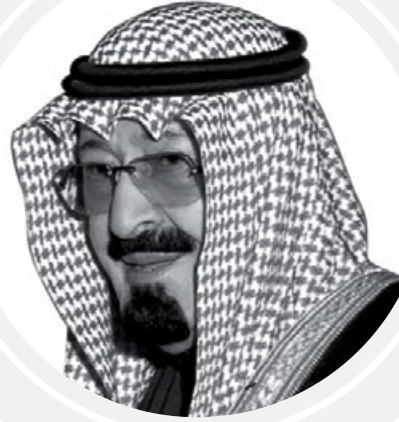
خادم الحرمين الشريفين الملك عبدالله بن عبدالعزيز آل سعود ملك المملكة العربية السعودية